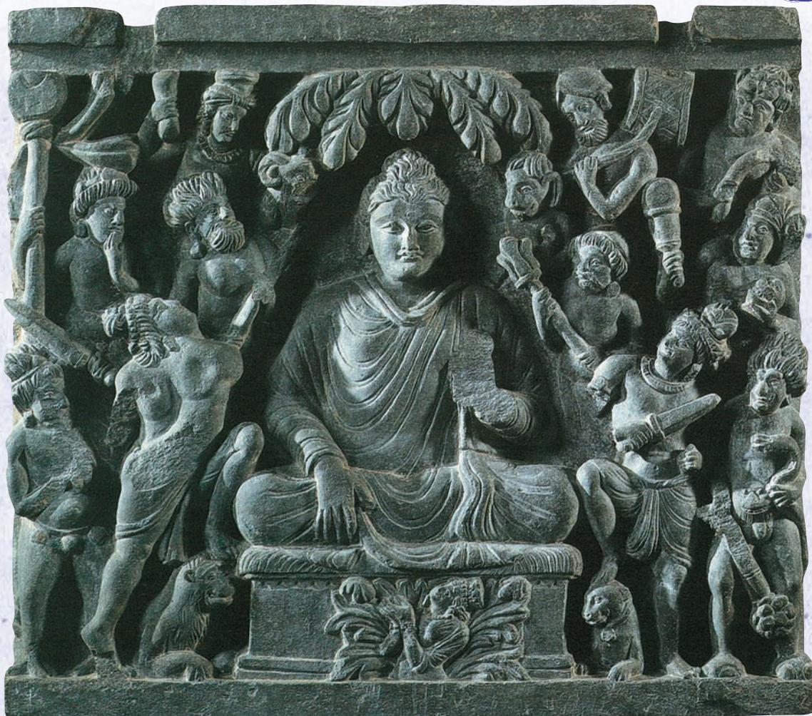
こう ま しょうどう