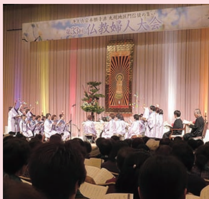
第33回九州仏教婦人大会・宮崎